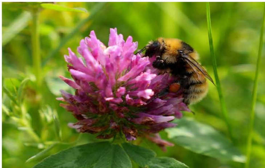
Naturmangfold og trua natur. Illustrert med sterkt truet kløverhumle.