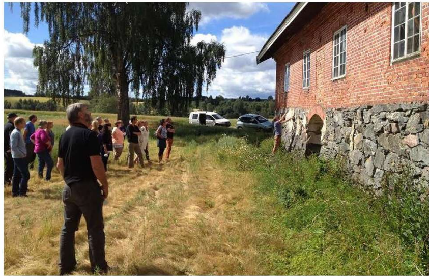
Eldre uthus: Bevaring, istandsetting, nye teknologiløsninger og bruk