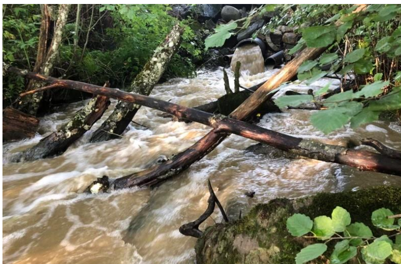
Romerike - raviner - ras - regn