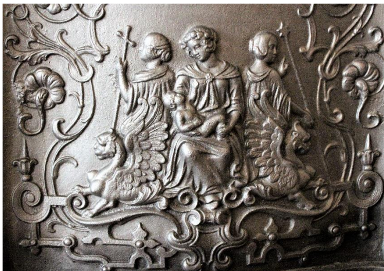
Gamle ovner og skorsteiner og utfordringene som eierne møter