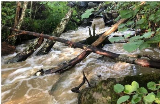
Romerike - raviner - ras - regn