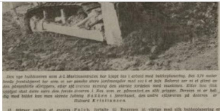
ENORME AREALER: Enorme områder ble bakkeplanert i Nes.

I ettertid mener hun man sikkert kan si at ting kunne vært gjort annerledes og på en bedre måte, men arbeidet ble gjort ut ifra slik situasjonen var da. Hun forklarer også at bakkeplaneringen har gjort det rasutsatte landskapet mer stabilt.